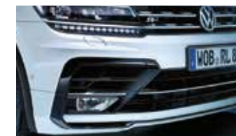
Pare-chocs avant 'R-Line'