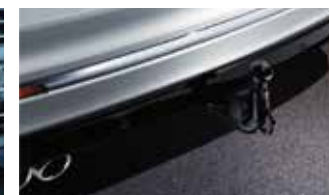
Pare-chocs arrière 'R-Line' avec boule d'attelage